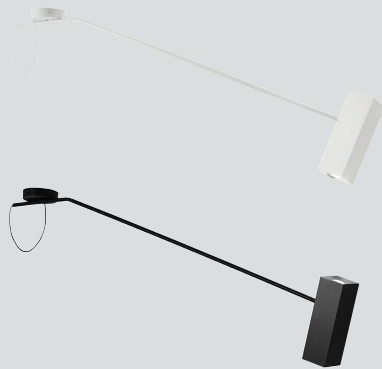
DEJEPL165G01 – WHITE DEJEPL165G02 – BLACK

— Lampada da soffitto con possibilità di rotazione sull'asse di 170° e diffusore orientabile. Struttura metallica verniciata nei colori bianco o nero opaco, diffusore in alluminio. Cavo elettrico in tinta con la struttura. Predisposta per la doppia accensione.